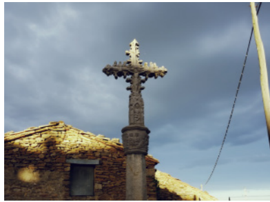
Crucero en Cincorres.