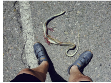
Carretera CV-14, al poco de abandonar Forcall.