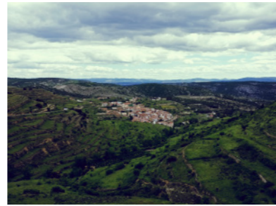
Portell de Morella entre terrazas de cultivo.