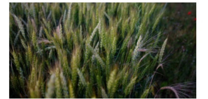
Espigas de cereal en las proximidades de Cantavieja.