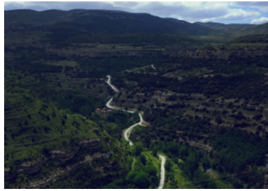
El barranco del Ojal visto desde Cantavieja.