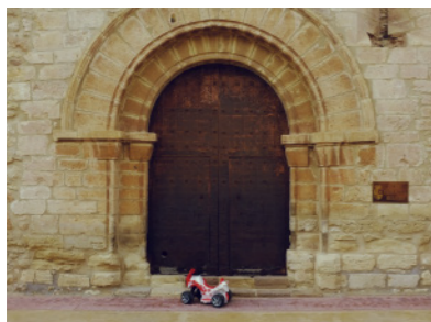
Pórtico de la Iglesia de Olocau del Rey.