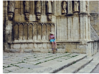
Pórtico de la Catedral de Morella.