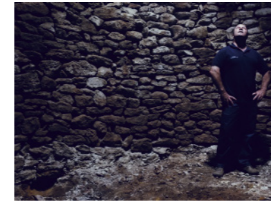
El alcalde de Olocau del Rey, en el interior del nevero.