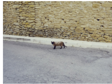
Callejón de Todolella.