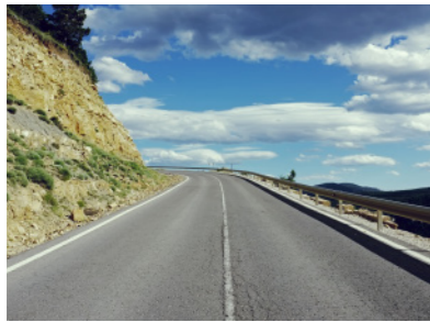
Rampa del Puerto de Linares.