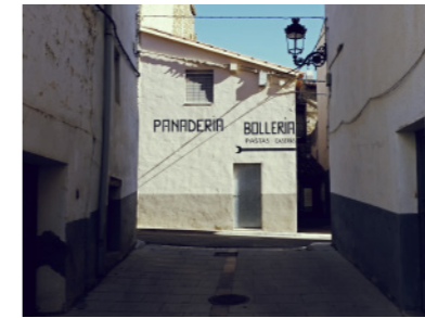
Callejón de Cincorres.