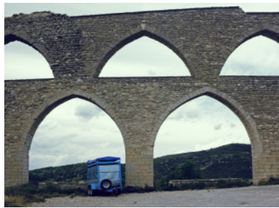
Acueducto de Morella.