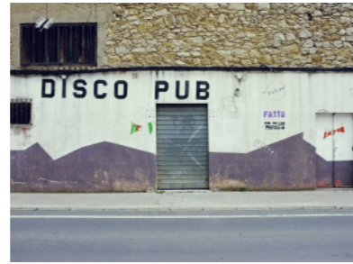
Discoteca en Villafranca del Cid.