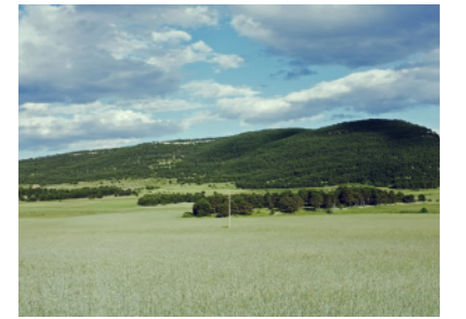
Campo de secano en el llano de Mosqueruela.