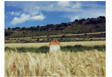
Mojón kilométrico entre Olocau del Rey y Todolella.