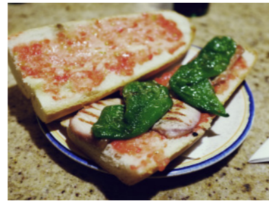
Bocadillo de lomo y pimientos en Cincorres.