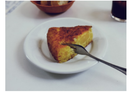
Tortilla de patata y ajo en Morella.