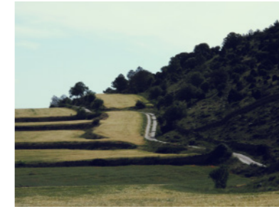
Camino de La Mata a Bordón, cerca de Olocau.