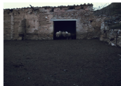
Olocau del Rey.