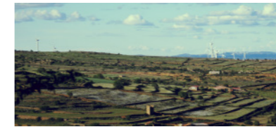
Terrazas de cultivo en Cantavieja.